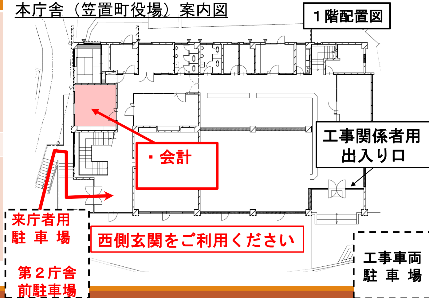
本庁舎（笠置町役場）案内図