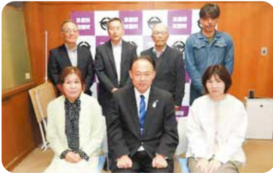
前列左から小谷委員・町長・渡利委員 後列左から北川委員・北口委員・巽委員・滝口委員