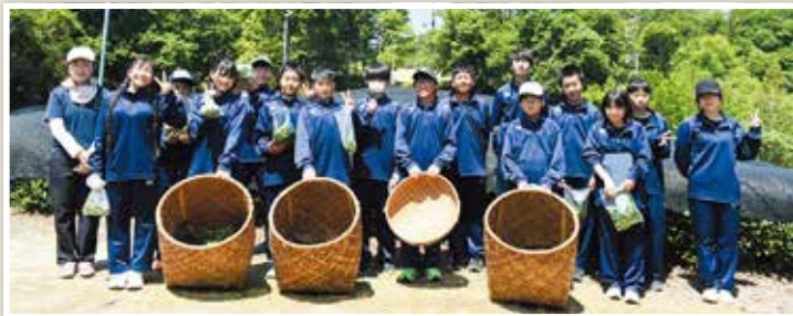
笠置中学校のお茶摘みの様子(笠置町・南山城村)

5月18日(月)、笠置中学校でお茶摘みを行いました。 晴天の中、真剣な顔や楽しそうな姿で「一芯二葉」を摘み取っていました。 子どもたちの楽しんでいる笑顔が見受けられました。