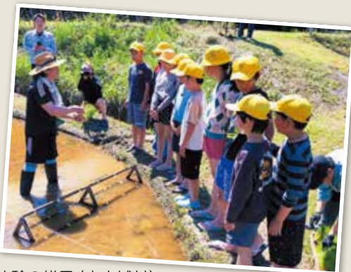
南山城小学校の田植え体験の様子(南山城村)