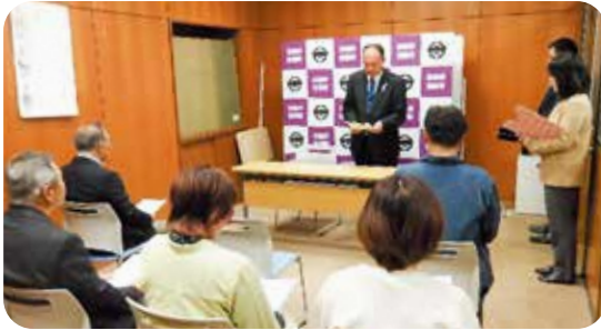
町長から委員への挨拶