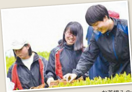
お茶摘みの様子(和東町)

5月7日(木)、わづかこども園・和東小学校・和東中学校でお茶摘みを行いました。 子どもたちは、地域の方や先生と一緒に慣れた手つきで「一芯二葉」を摘み取っていました。 お茶摘みは小・中連携の一環として取り組んでおり、去年に引き続き保育園児も加わりお茶摘みの体験をもとに小・中学校・保育園のつながりが深まったと思います。