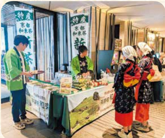
リーガロイヤルホテル京都での和束茶PRの様子

イベント当日には、多くのお客さまがお越しください、和束茶を味わっておられました。また、国内のお客様のみならず、海外の観光客からもご好評をいただきました。新茶の振る舞いに加え、和束町の観光PRも行い、多くの方に和束町を知っていただく機会となりました。