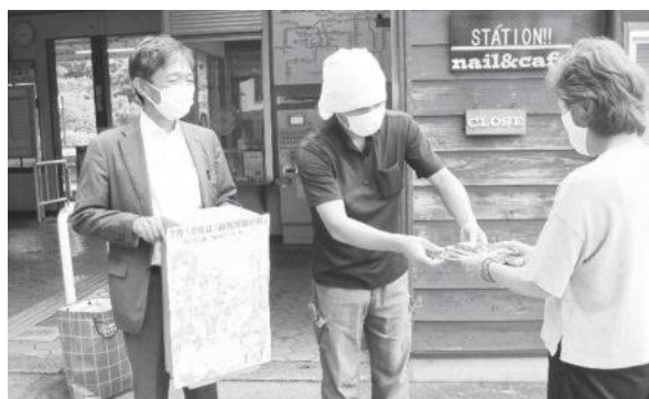
JR笠置駅前での街頭啓発活動