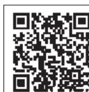
QRコードからもHPにアクセスできます。